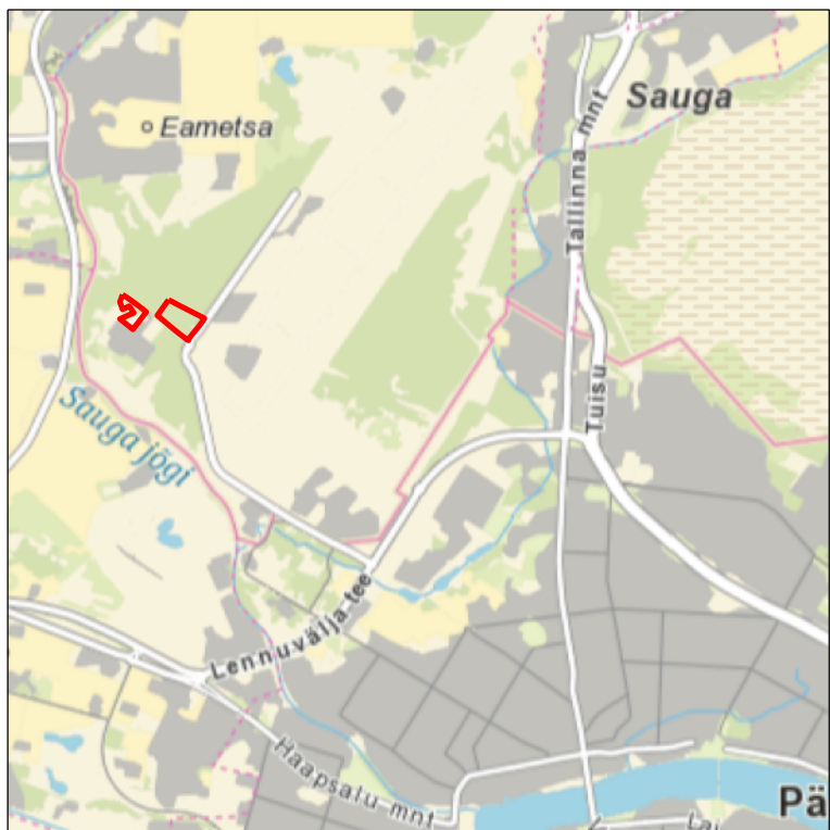
Kaardilehed nr 5332 Pärnu, 5334 Pärnu-Jaagupi